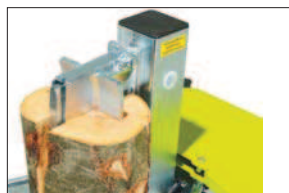
Štípací kříž (F0001831)