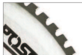
Vidiový pilový kotouč (Z1300103)