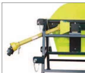
Stolní pila na kolech s kloubovým hřídelem