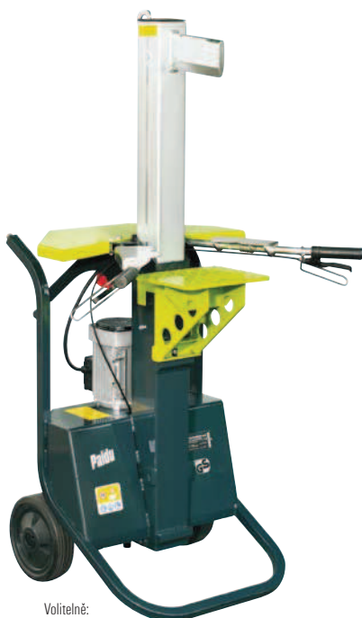
Volitelné: Odkládací stůl

Silná štípačka dřeva se štípací silou 6 t, nastavitelným štípacím zdvihem a nastavováním výšky štípacího stolu bez použití nářadí pro ergonomické štípání. Max. délka polena: 105 cm