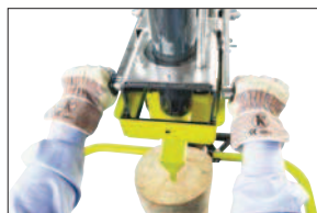
Sériově dvouruční bezpečnostní zapínání