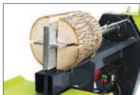
Štípací kříž (F0001893)