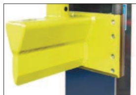
Štípací nůž s mosaznými vedeními s dlouhou životností, sériově