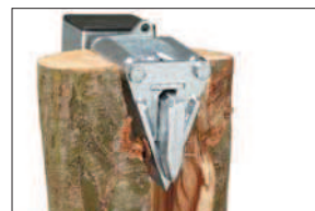
Speciální nůž s válečky pro metrové dřevo (F0001654)