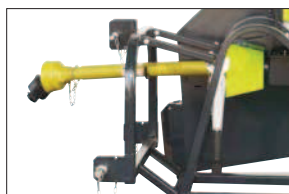
S kloubovým hřídelem