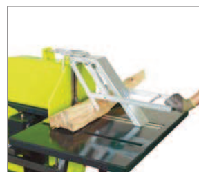
Stůl na kolech s kuličkově uloženým vedením