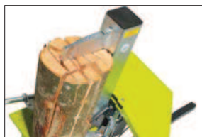
Snadno a rychle