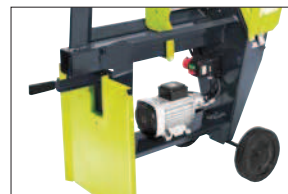
Odkládací stůl (F0001899)