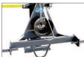
Sériové třířidlové zavěšení