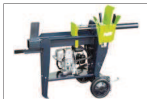
Horizontální štípačka 550 s benzinovým motorem