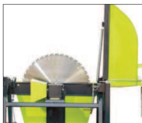
Otevřený stůl na kolech