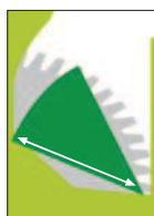
Délka hrany polena