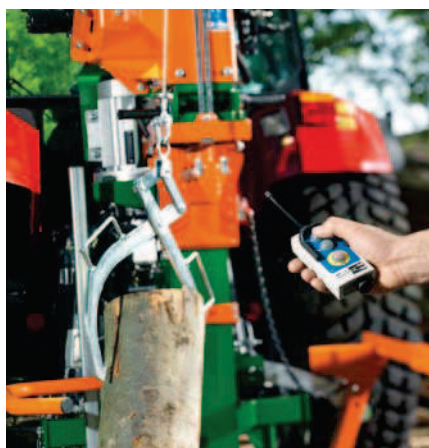
Lanový naviják WF s radiovým ovládáním