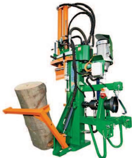
HydroCombi Turbo s hydraulickým zařízením pro zvedání kmenů