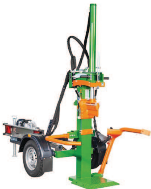
HydroCombi 13 E5,5D-V2 s vozíkem v pracovní poloze