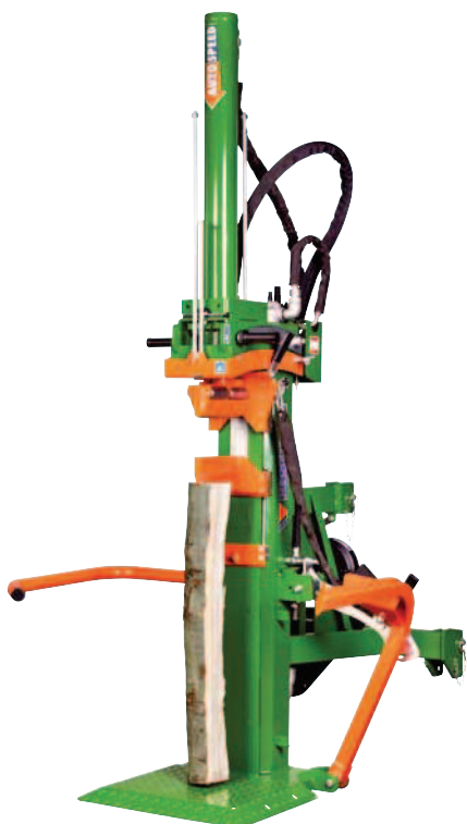
HydroCombi 18 PZG-R volitelně: Držák pro motorovou pilu