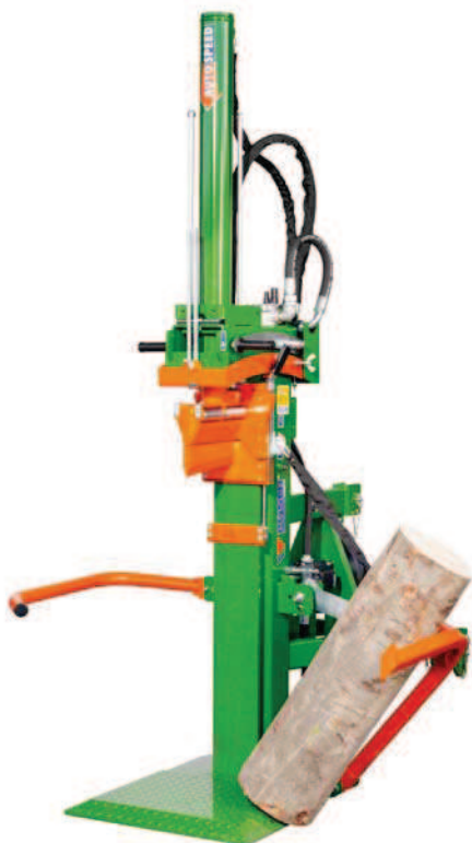
HydroCombi 20 PZG-R