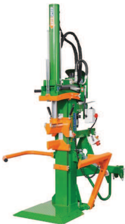
HydroCombi 26 E7,5D-R