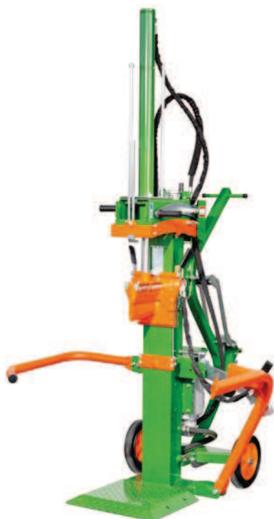
HydroCombi 10 E5,5-V2