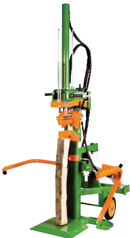
HydroCombi 13 PS-V2