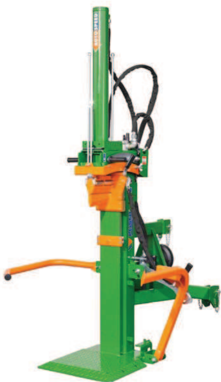
HydroCombi 16 PZG-R