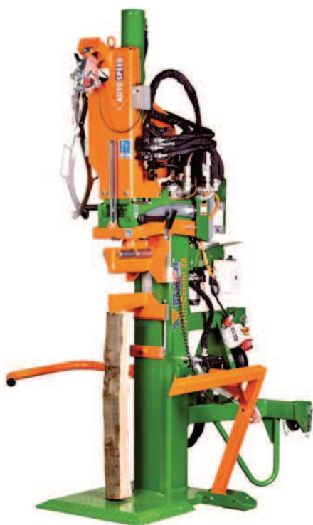
HydroCombi 22 PZG-E7, 5DR volitelně: Lanový naviják a kleště pro uchopení