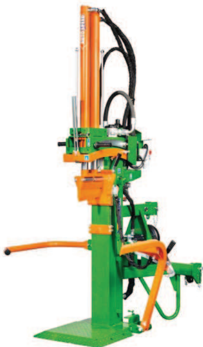
HydroCombi 16 PZG-E5,5D-R Turbo