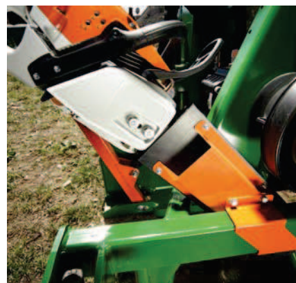
Volitelný držák pro motorovou pilu (F0003357) pro bezpečnou přepravu a praktickou možnost odložení motorové pily