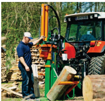
Hydraulické zařízení pro zvedání kmenů pro větší komfort obsluhy.