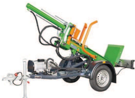
HydroCombi 13 E5,5D-V2 s vozíkem v přepravní poloze