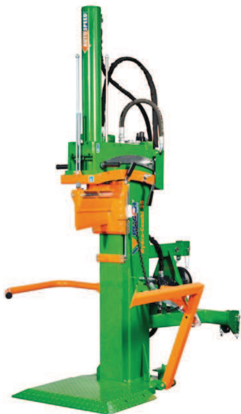
HydroCombi 30 PZG-R