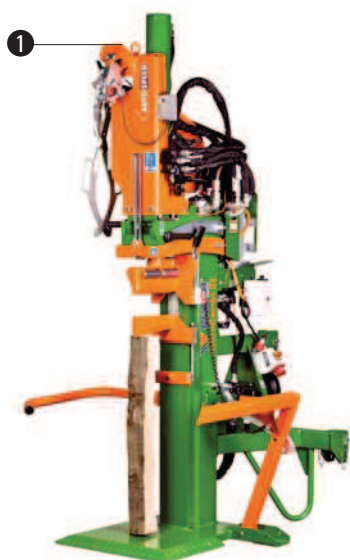
HydroCombi s lanovým navijákem WF a kleštěmi pro uchopení