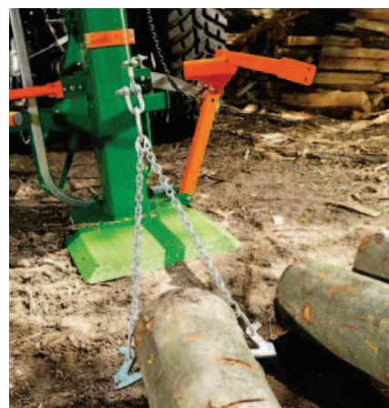
Háky na kmeny k lanovému navijáku