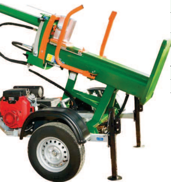
Ilustrační obrázek: HydroCombi 20 B15-R-PKW+L v přepravní poloze