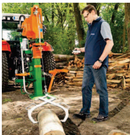
Lanový naviják WF s kleštěmi pro uchopení a radiovým ovládáním

Lanový naviják je pohodlný pomocník při práci se dřevem. Kmeny se bez námahy dotáhnou ke stroji a uvedou do štípací polohy. Jemný náběh a jemné spouštění zajišťují plynulý pohyb kmenů. Výška horní hrany lanového navijáku ①: HydroCombi 16/16 Turbo/18: 2,46 m; HydroCombi 20/22: 2,49 m; HydroCombi 24 Turbo/26/30: 2,52 m.