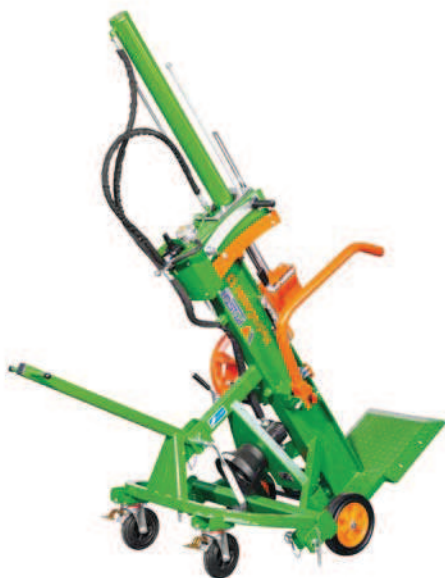
HydroCombi 13 PZG volitelně: vozidlové zařízení (F0003117), přepravní poloha