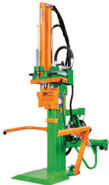
HydroCombi 24 PZG-Turbo