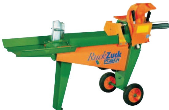
RuckZuck E3, volitelně: otočný štípací kříž (F0001893) a odkládací stůl (F0001421)

Pohodlná vodorovná štípačka dříví pro použití v domácnosti.