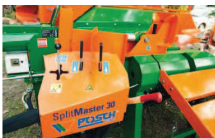
Dvouruční ovládání. Joystick pro zdvihací zařízení a nastavování nože.