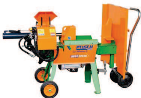
SplitMaster 9 E5,5-R v přepravní poloze s přepravní pomůckou, volitelně: velký odkládací stůl (B)