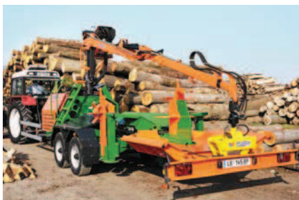
SplitMaster 40 / 55 Crane v přepravní poloze.