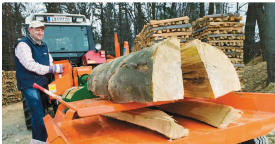
SplitMaster 20, volitelně se štípacím nožem „Easy“ a podélně taženým traktorovým podvozkiem.

optimální velikost pro uskladnění a pozdější zpracování. Horní, příliš velká polena lze pomocí jednoruční sapiny bez námahy vytáhnout ze štípacího nože a dočasně je uložit na zdvihacím zařízení resp. je umístit do štípacího kanálu pro další štípání. Pohodlná práce a efektivní štípání palivového dříví.