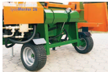
Traktorový podvozek DT s odnímatelnou ojí pro SplitMaster.