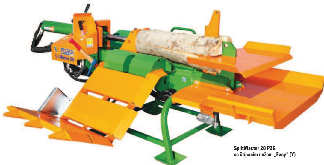
SplitMaster 20 PZG se štípacím nožem „Easy“ (Y)