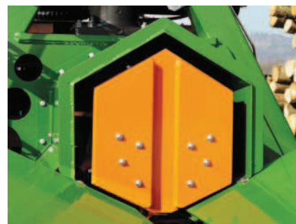
Lisovník protlačuje štípané dřevo štípacím nožem silou větší než 40 / 55 t.