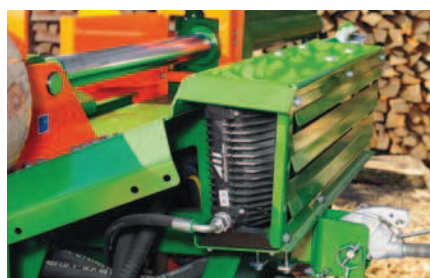
Olejový chladič (C) pro SplitMaster 26 / 30.