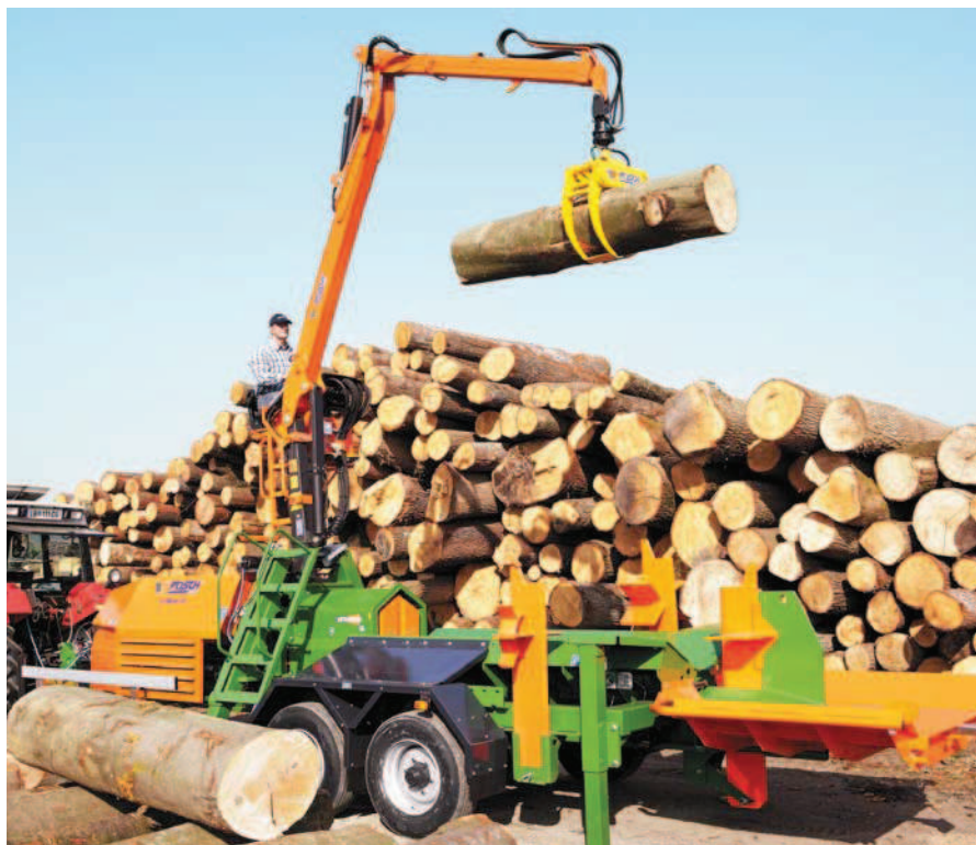
SplitMaster 55 Crane. Nakládací jeřáb zvedá kmeny o hmotnosti až 1 200 kg do štípacího koryta.