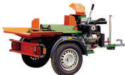
SplitMaster 9 s pojezdem