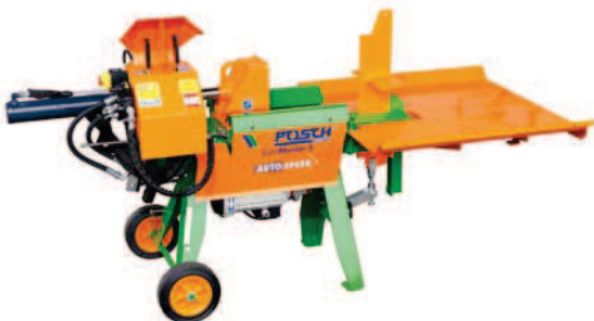
SplitMaster 9 E5,5-R, volitelně: velký odkládací stůl (B)

Ergonomická vodorovná štípačka dříví pro použití v domácnosti a zemědělství.