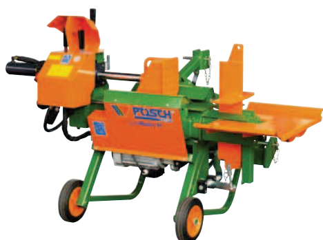
SplitMaster 9 PZG-E5,5-R