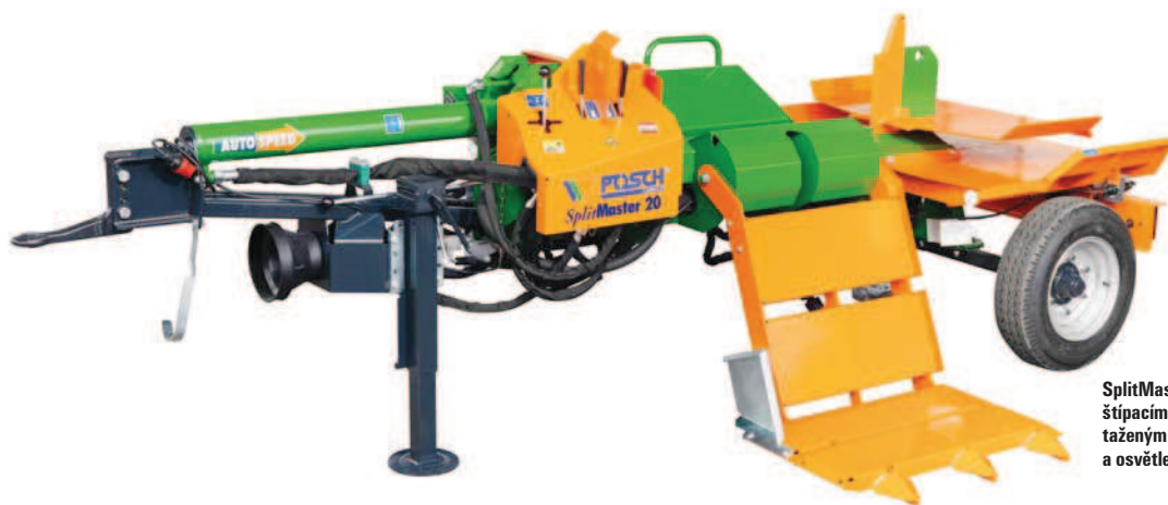
SplitMaster 20 PZG volitelně se štípacím nožem Easy (Y), podélně taženým traktorovým podvozkiem (T) a osvětlením (L)