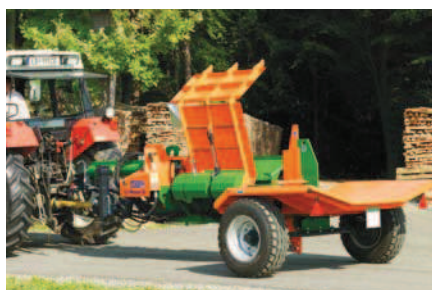
SplitMaster 30 s podélným traktorovým podvozkem pro mobilní použití.