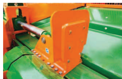
Velký tlačný prvek pro problematické dřevo s o 40 % delším vedením pro delší životnost