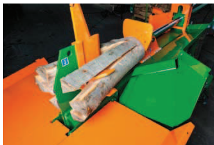
Vložený plech pro SplitMaster 30