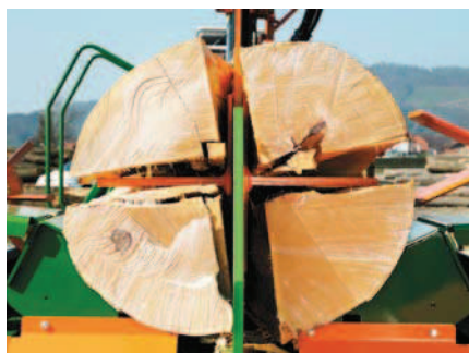
Hydraulicky nastavitelný štípací nůž pro silové štípání dřeva.