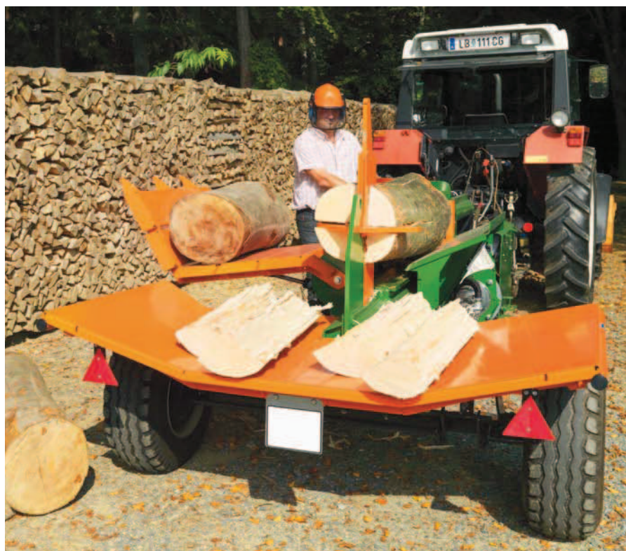
SplitMaster 30 s traktorovým podvozkem.