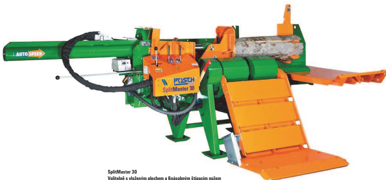
SplitMaster 30 Volitelně s vloženým plechem a 6násobným štípacím nožem