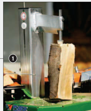
Pomocí hrotu pro upevnění dřeva lze snadno a bez námahy upevnit i tenké nebo šikmo odříznuté dřevo.