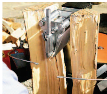
Nasazovací štípací nůž s válečky šetří sílu při štípání. Dřevo rychle praskne a válečky na štípacím noži zabrání zaklínění naštípaného dřeva při zpětném chodu.