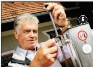
Štípací zdvih lze plynule nastavovat.