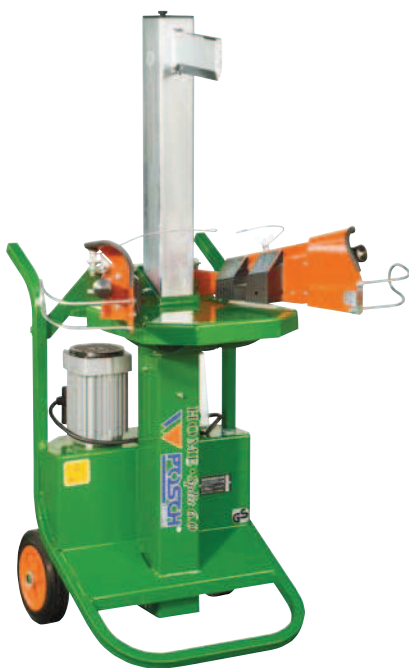
HomeSplit 6 E3