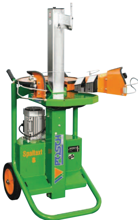
SpaltAxt 8 E5,5 Turbo