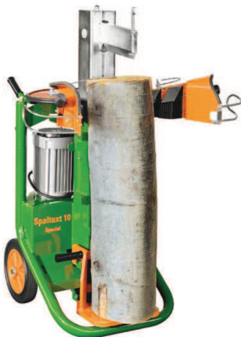
Spodní deska pro SpaltAxt 10 (F0002535)