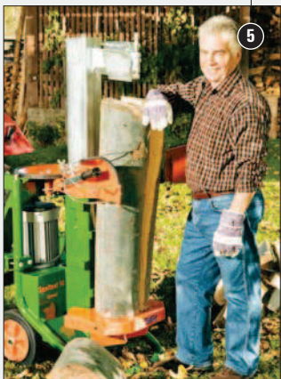
Speciální provedení umožňuje i občasné štípání metrového dřeva (štípací zdvih 54 cm).