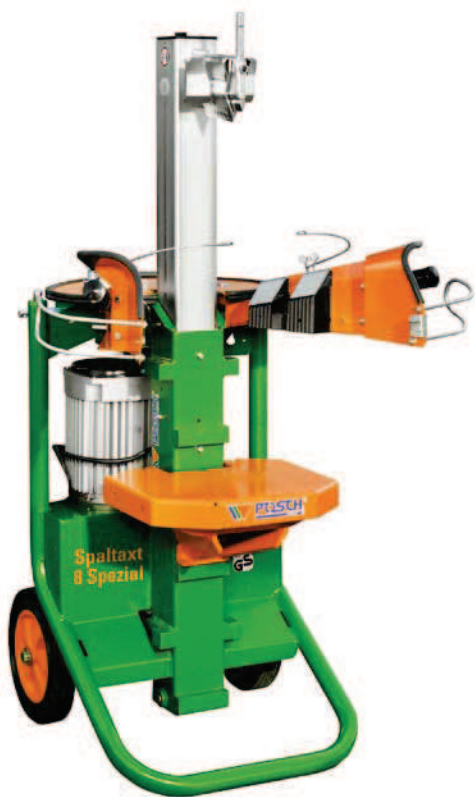
SpaltAxt 8 Spezial Štípací stůl v prostřední zavěšené poloze, volitelně: štípací kříž