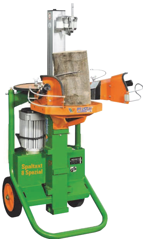
SpaltAxt 8 Spezial E5,5 Turbo Štípací stůl v horní zavěšené poloze, volitelně: štípací kříž