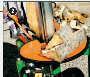
Sériový odkládací stůl slouží k dočasnému odložení polena během štípání.