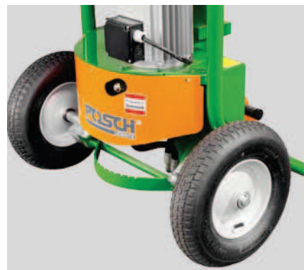
Sada kol naplněných vzduchem (F0002581)