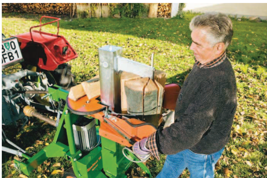
SpaltAxt 10 Spezial PZG-E5,5 Turbo

Turbo model: Vysoce výkonná štípačka pro ještě vyšší štípací rychlost