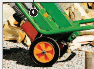
Velká celopryžová kola s Ø 300 pro pohodlnou přepravu.