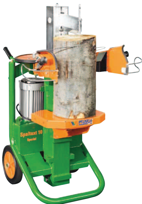
SpaltAxt 10 Spezial E5,5 Turbo Štípací stůl v střední zavěšené poloze