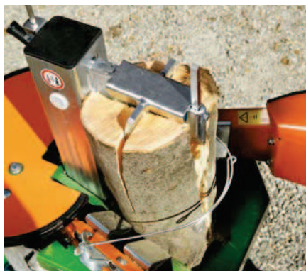
Štípací kříž pro SpaltAxt 8 (F0002543) bez námahy zvládne čtyři polena v jednom pracovním kroku.

Comfort Paket skládající se z nasazovacího štípacího kříže pro čtyři díly a velkého odkládacího stolu je k dispozici jako základní vybavení nebo k dodatečné montáži pro stroje SpaltAxt 8, SpaltAxt 8 Spezial a SpaltAxt 10 Spezial.