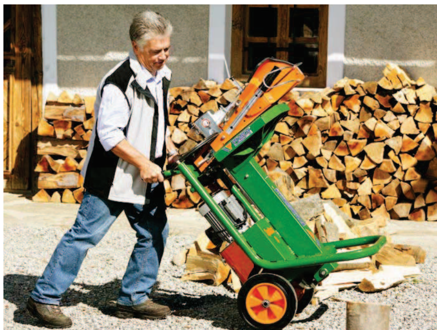
SpaltAxt 8 se vyznačuje mnohostranným použitím.

Turbo model: Vysoce výkonná štípačka pro ještě vyšší štípací rychlost