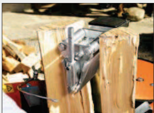
Nasazovací štípací nůž s válečky (sériově u strojů SpaltAxt 8 Spezial a SpaltAxt 10 Spezial) šetří při štípání sílu. Dřevo rychle praskne a válečky na štípacím noži zabrání zaklínění naštípaného dřeva při zpětném chodu.