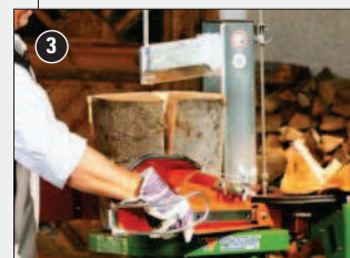
Turbo model: Vysoce výkonná štípačka pro ještě vyšší štípací rychlost.