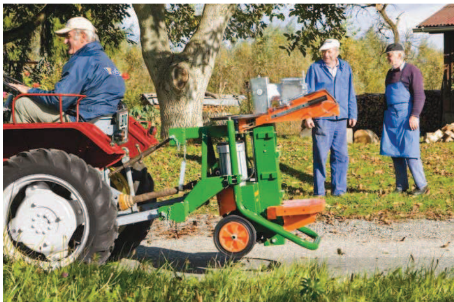
Snadná přeprava: štípačka SpaltAxt 10 Spezial s tříbodovým zavěšením (F0002577) jako doplňkovým vybavením.