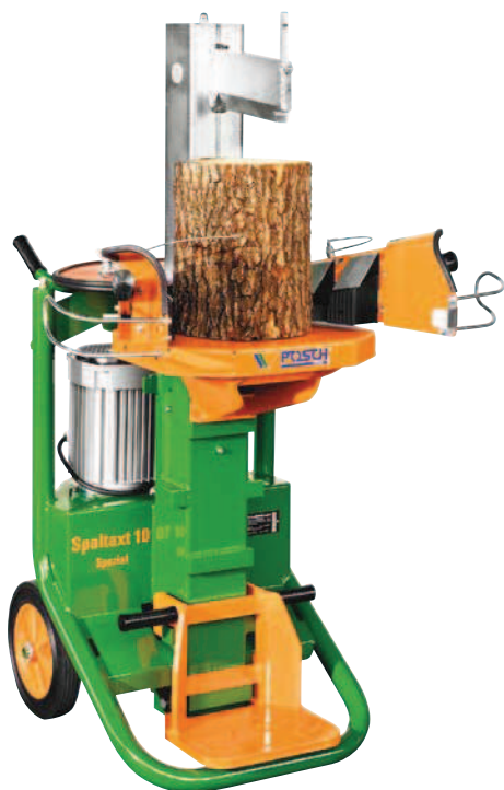
SpaltAxt 10 Spezial E5,5 Turbo Štípací stůl v horní zavěšené poloze, volitelně: spodní deska