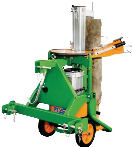
Třibodové zavěšení pro SpaltAxt 8 (F0002576)