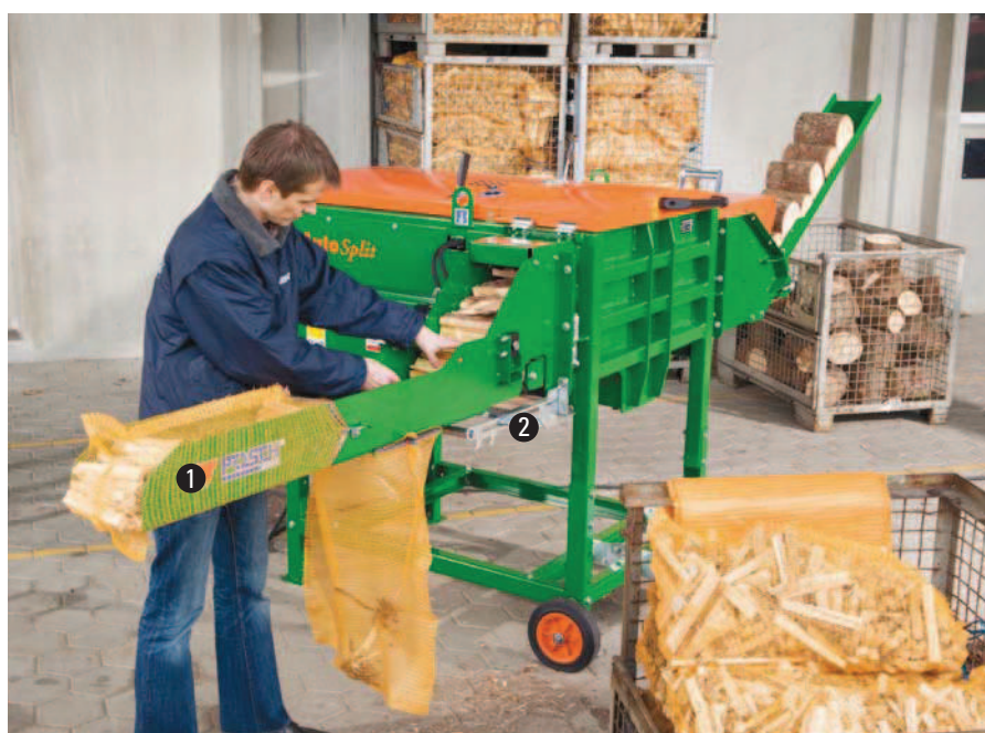
● AutoSplit 250 s balícím korytem pro vrstvené balení .

Tip: Pro optimální kvalitu podpalových třísek by měl výchozí průměr dřeva činit minimálně 15 cm.