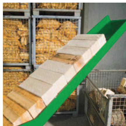
AutoSplit 250 udělá podpalové třísky hravě i z hranolů.