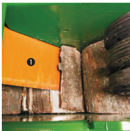
V jádru stroje štípe štípací nůž ve tvaru písmene V 1 ve 3sekundovém rytmu kulatinu a hranoly a zpracovává je na podpalové třísky připravené na zátop.