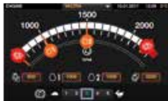
Upravování nastavení posouváním prstem na požadovanou hodnotu a automatické uložení do paměti.