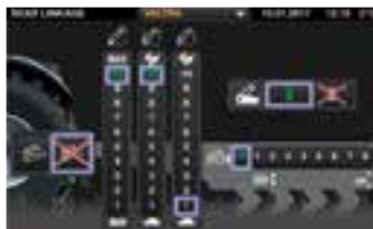
Intuitivní způsob nastavení pomocí velkých zobrazovacích prvků a snadno pochopitelných symbolů.