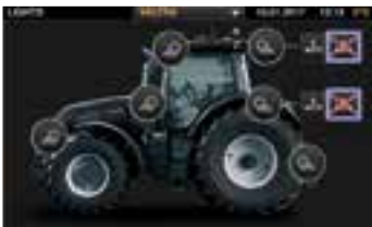
Snadné zapínání a vypínání vybraných pracovních světel dotykem na displeji. Aktivační spínač je spolu s tlačítkem zapínání majáku umístěn v loketní opěrce.