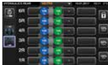
Nastavení hydraulických okruhů (čas a průtok). Vyberte si, kterým ovládacím prvkem budete ovládat hydraulické okruhy, přední a zadní tříbodový závěs a čelní nakladač.