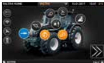
Přehledná struktura hlavního obrazkového menu.

Valtra SmartTouch posouvá ovládání traktoru na zcela novou úroveň. Je mnohem intuitivnější než ovládání vašeho chytrého telefonu. Veškerá nastavení jsou snadno přístupná pouze v rámci dvou kliknutí nebo posunutí prstem. Všechny moderní technologie jako např. navigace, Isobus, telemetrie a systémy precizního zemědělství jsou integrovány do nového, snadno použitelného formátu.