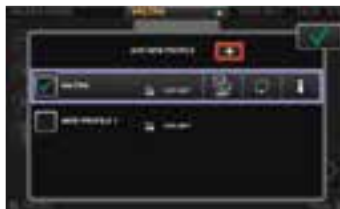
Pro jednotlivé řidiče a pracovní operace lze snadno vytvářet profily. Nastavení ve vybraném profilu se dají jednoduše upravit a všechny změny se uloží do paměti.